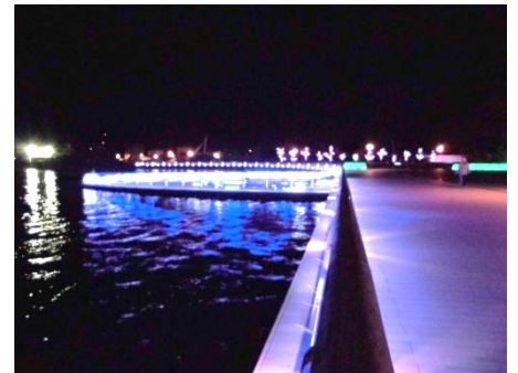
水辺のライトアップ