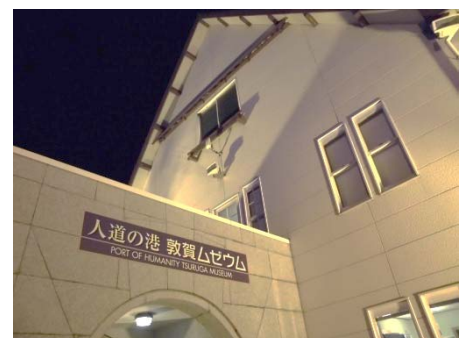
ムゼウムもライトアップ