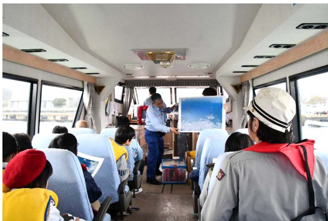
まつかぜ船内の様子 港に興味津々です！

参加した子供達が海に沢山ふれあい、今後さらに港や船に興味を持ってくれると嬉しいですね！もししたら今回参加した子供達が大人になって一緒に港に関わる仕事ができたら……なんて想像したらこちらも楽しくなりました。