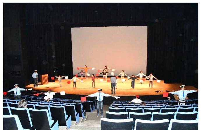
敦賀海洋少年団と手旗体験！