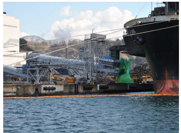
チップ船からベルトコンベアにチップを降ろす