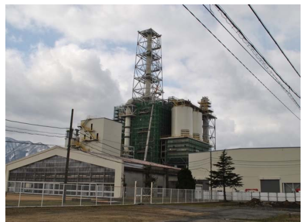
バイオマス発電所 (H29. 3. 3撮影)