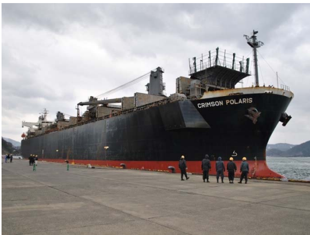
初入港のチップ船 大きい！