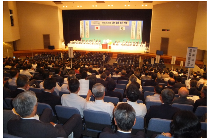
定例総会の会場全体の様子