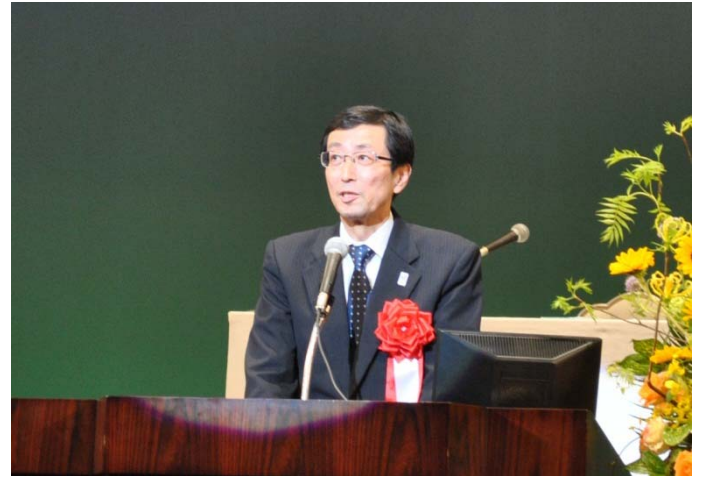
大脇 崇 国土交通省大臣官房技術参事官 の祝辞