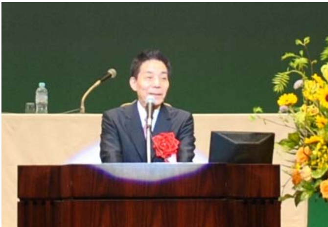
古賀 誠 元衆議院議員の祝辞