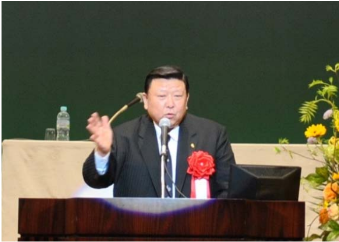
河瀬 一治 敦賀市長の挨拶