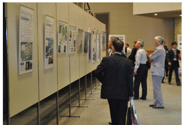
会場内に敦賀港のパネルを展示