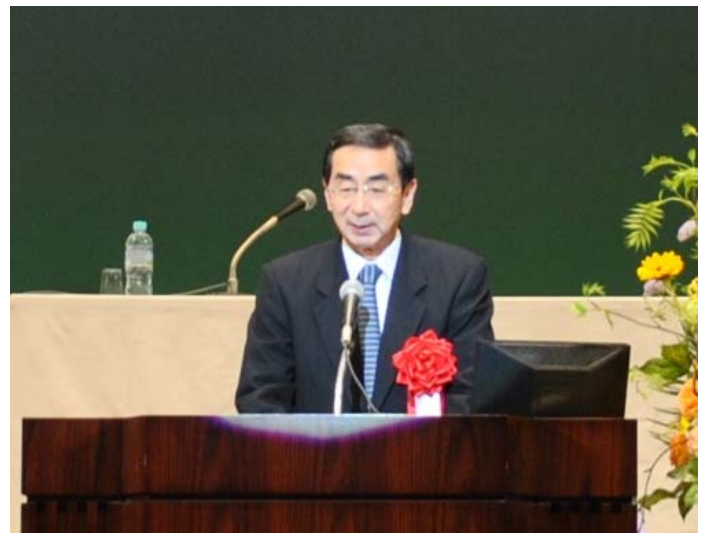
西川 一誠 福井県知事の挨拶