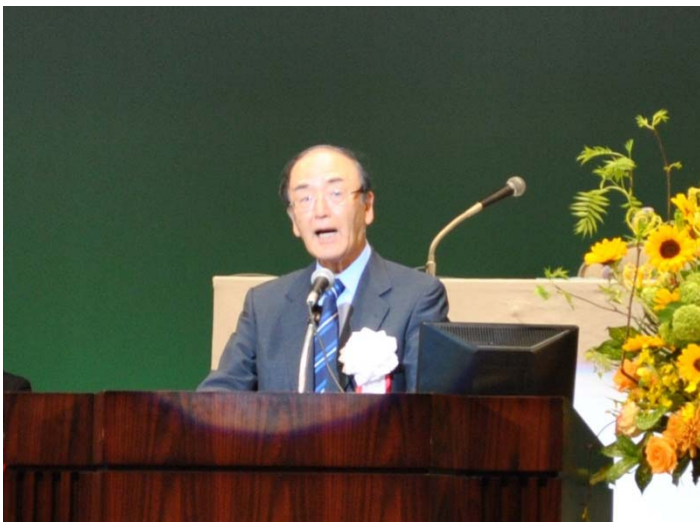
三村 明夫 日本港湾協会会長の挨拶